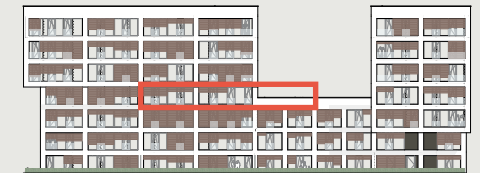
Ansicht Ost | Wasserseite